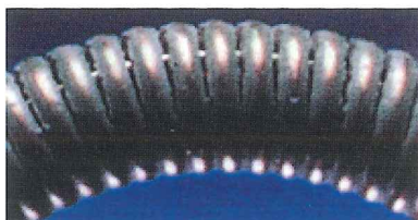
スプレーコートタイプ (当社従来品)