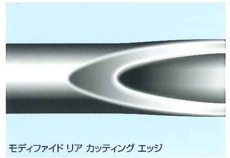
モディファイド リア カutting エッジ