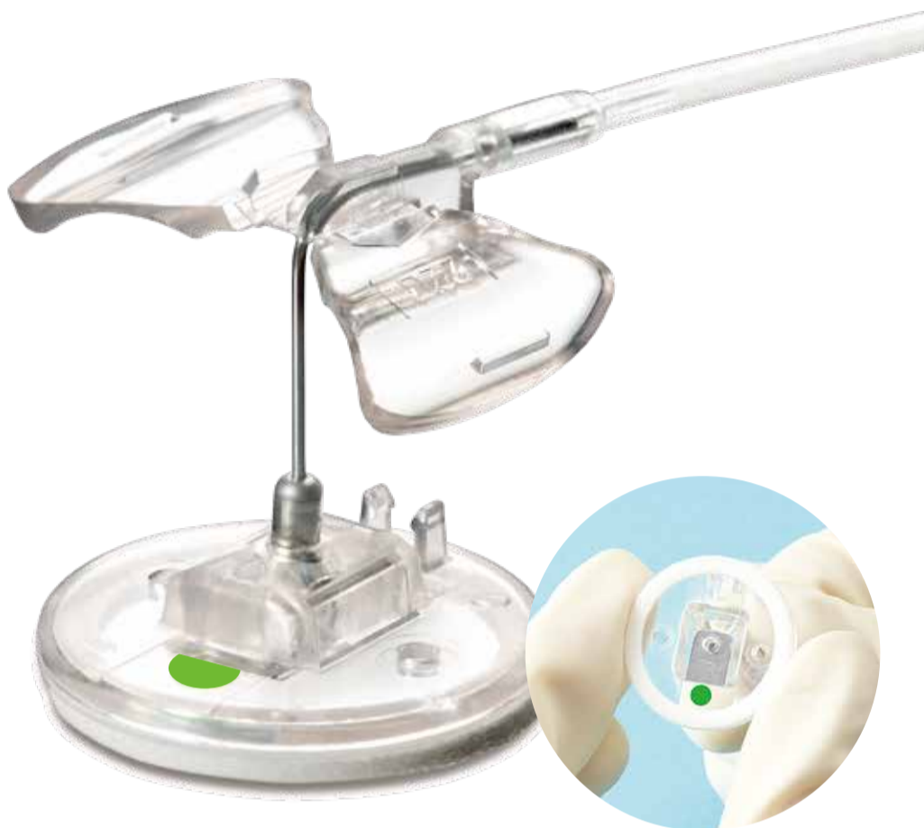
セーフティ作動後