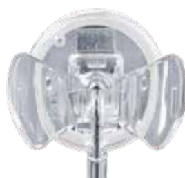
セーフティ作動前